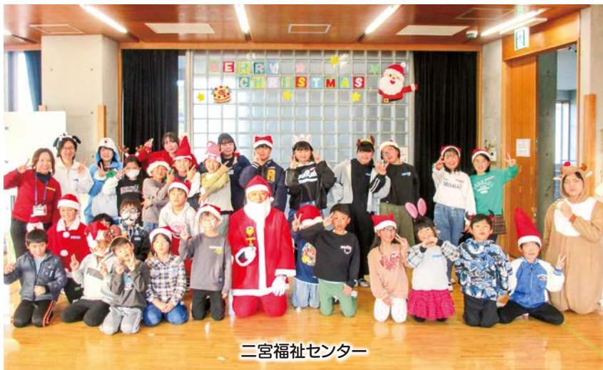
二宮福祉センター