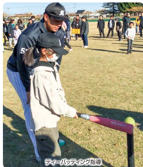
ティーバッティング指導