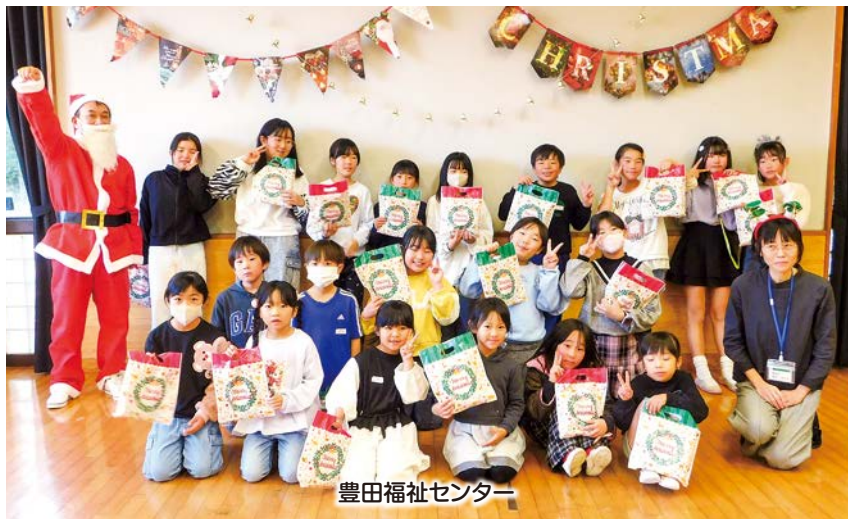
豊田福祉センター

昨年12月に市内福祉センターにある各児童センターで「クリスマス会」を開催しました。児童センターではさまざまな教室を開催しています。予定については本会のHPやInstagramなどでもご確認いただけますので、ぜひご活用ください。