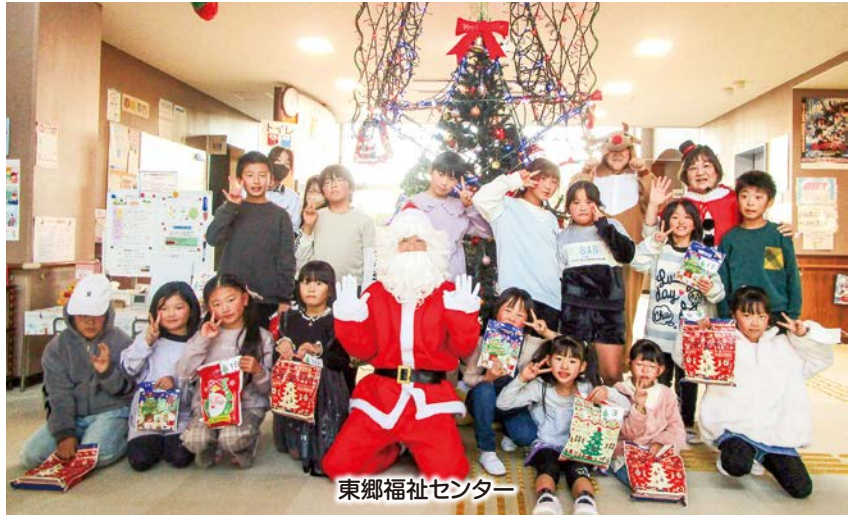
東郷福祉センター