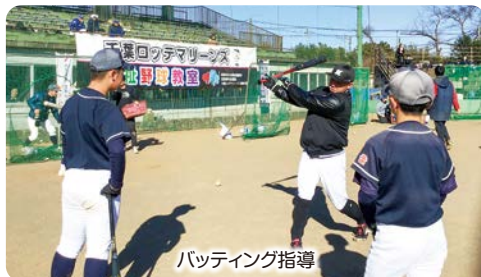
バッティング指導