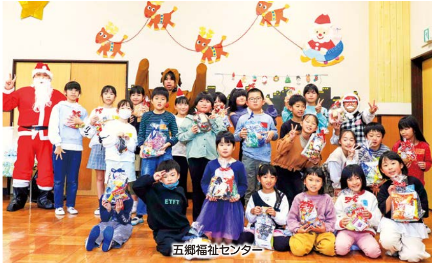
五郷福祉センター