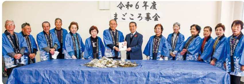
茂原市長寿クラブ連合会のみなさん

12月11日、茂原市長寿クラブ連合会様の会員様より、まごころ募金として歳末たすけあい募金に寄付していただきました。