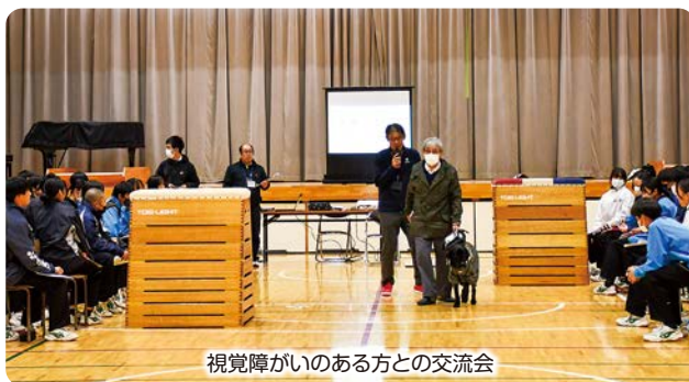
視覚障がいのある方との交流会