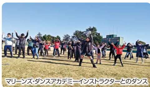
マリーンズ・ダンスアカデミーインストラクターとのダンス