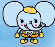
茂原市社協 マスコット「ふくぞう」