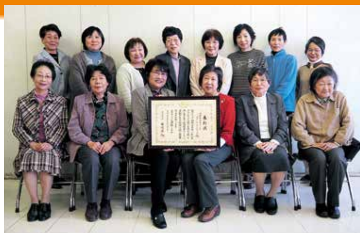
地区ボランティア会長のみなさん

各地区のボランティア会では、一緒に活動してくれるボランティアを募集しています。料理の好きな方、地域の中で何かを始めてみたい方、是非、一度見学してみたい方がですか。当協議会までご連絡ください。