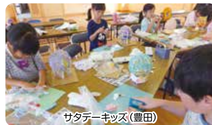
サタデーキッズ(豊田)