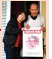
みなさまからの温かいお気持ちを届けました