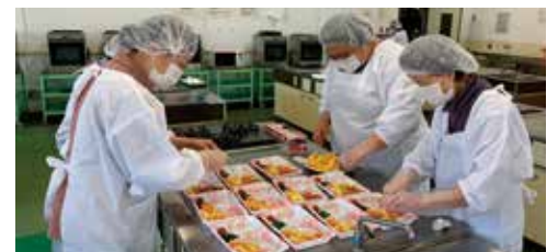
お弁当作りの様子

【団 体 名】西部ボランティア会 【活動内容】お弁当の調理、配達 【活動場所】五郷福祉センター 【配達地域】主に西小学校区 【活動日時】毎週金曜日(月3回程度) 12:00～16:00 ※準備・片付含む