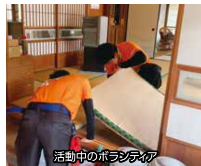
活動中のボランティア