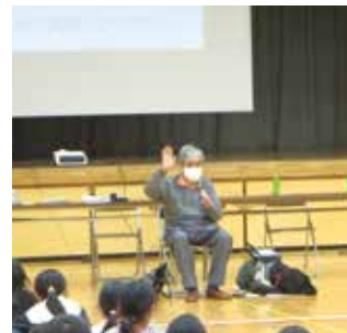
視覚に障がいある方との交流