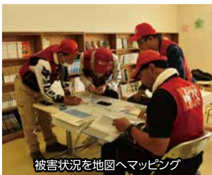
被害状況を地図へマッピング