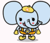
茂原市社協 マスコット「ふくぞう」