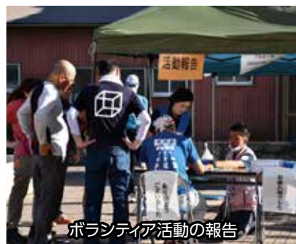
ボランティア活動の報告