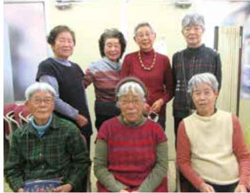
「すずらんの会」のみなさん

ひざ掛け作りのボランティアを募集しています。寄付された毛糸は家に持ち帰りモチーフを編んでひとつ一つを繋ぎ合わせて一枚のひざ掛けを作製します。興味のある方は本会までご連絡ください。