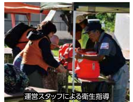
運営スタッフによる衛生指導