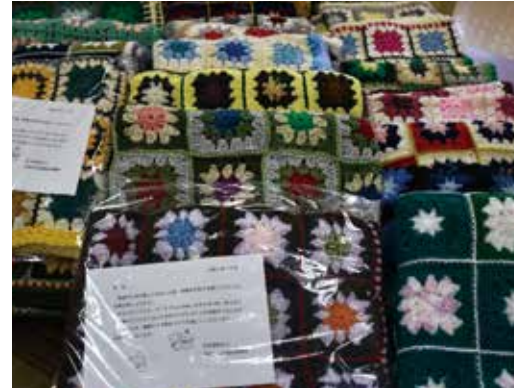
作製したひざ掛け