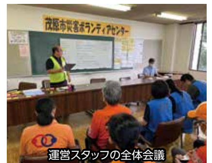
運営スタッフの全体会議