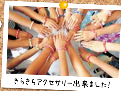
きらきらアクセサリー出来ました!