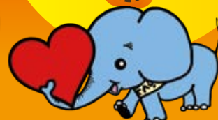
茂原市社協マスコット「ふくぞう」