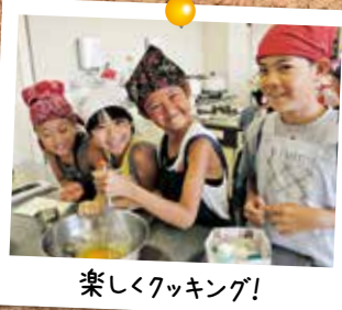
楽しくクッキング!