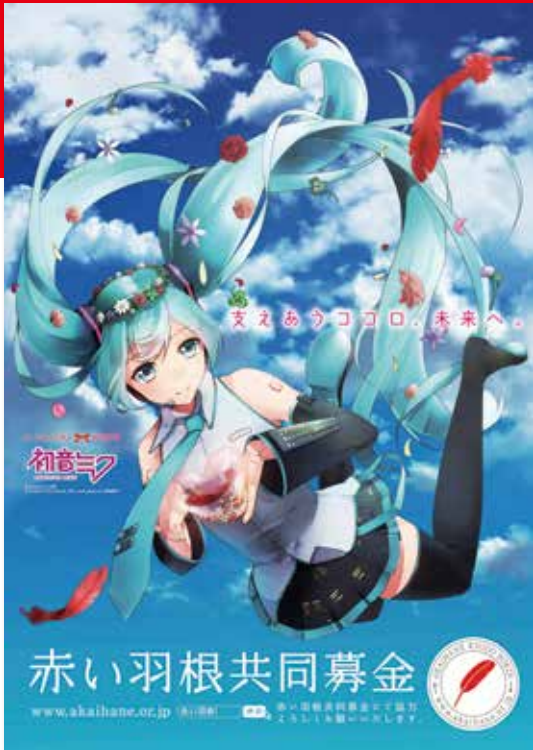
illustration by 羽雪 ©Crypton Future Media,INC.www.piapro.net piapro