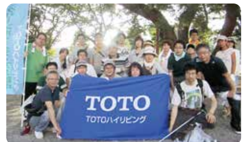
TOTOハイリビング(株)茂原工場のみなさん