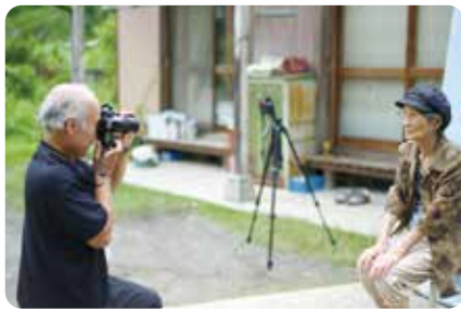
記念の1枚を撮影します

当協議会では、毎年、米寿を迎えられた方を対象に、記念撮影を希望する方の自宅等を訪問し撮影を行い、後日、出来上がった写真を額に入れて贈呈しています。