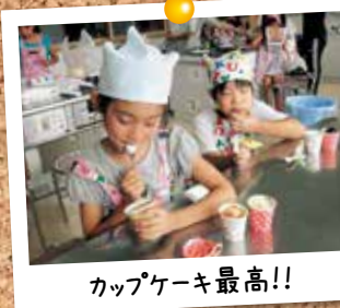
カップケーキ最高!!