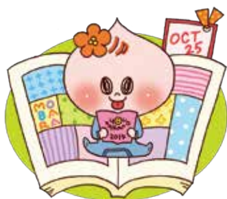
茂原市社会福祉協議会 × 高野優 2014