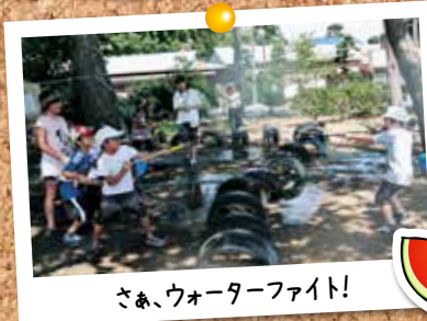
さあ、ウォーターファイト!