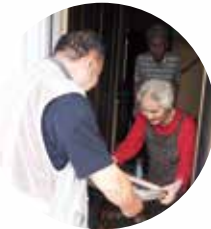
こんな感じで仕上がりました

今後も、たくさんの米寿という記念の一枚を、撮り続けていきたいと思えます。なお、上記3団体は会員を募集しています。活動や会員募集について、お気軽にお問い合わせください。