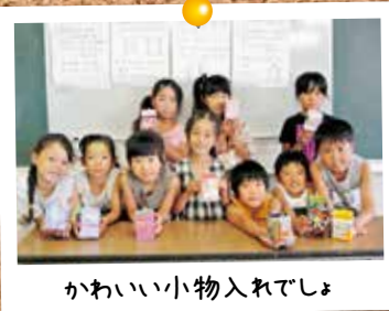
かわいい小物入れでしょ