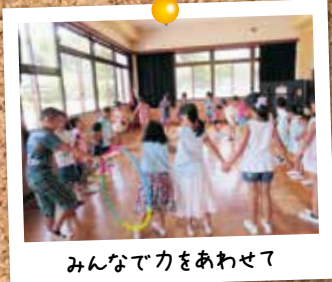
みんなで力をあわせて