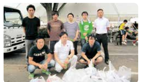
リコージャパン(株)茂原営業所のみなさん