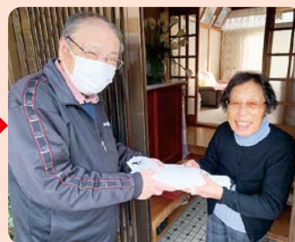
歳末見舞金・慰問品の配付