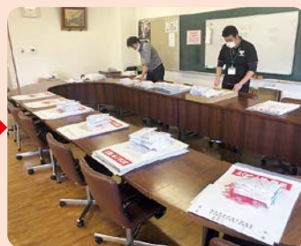
歳末見舞金・慰問品の配付準備