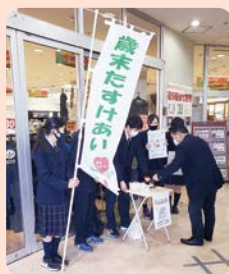
戸別・街頭などの募金活動