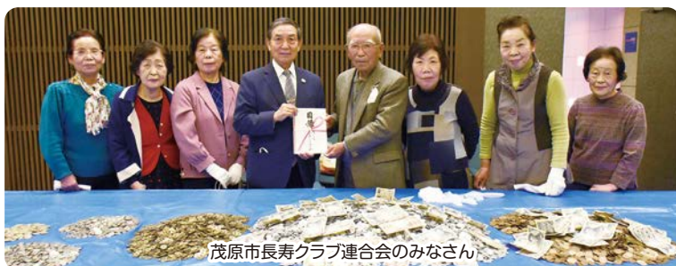
茂原市長寿クラブ連合会のみなさん

12月7日、茂原市長寿クラブ連合会様より、会員の方が1年間貯めた1円玉などを、歳末たすけあい募金に寄付していただきました。