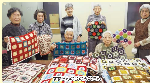
すずらんの会のみなさん