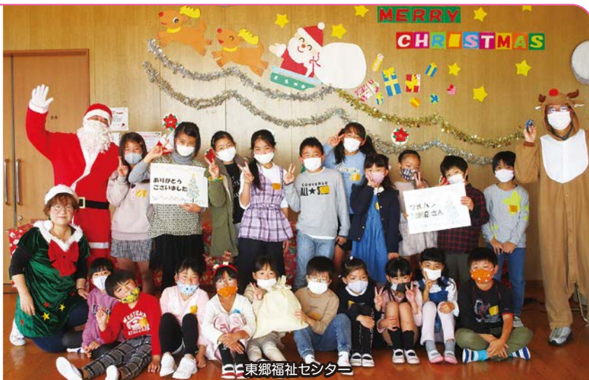
東郷福祉センター