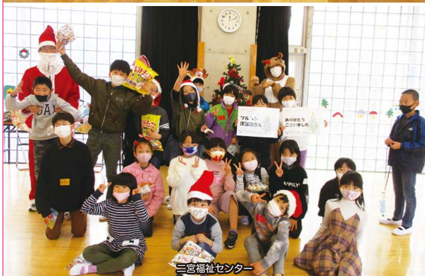
三宮福祉センター