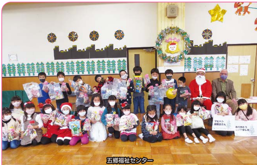
五郷福祉センター