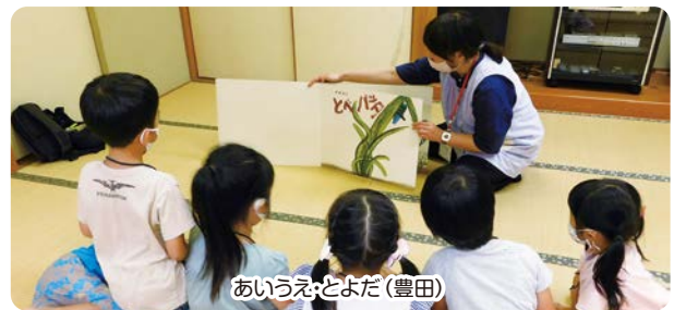
あいうえとよだ(豊田)

【お問い合わせ】総合市民センター ☎24-9511 二宮福祉センター ☎26-3740 豊田福祉センター ☎26-1105 五郷福祉センター ☎25-7880 東郷福祉センター ☎25-5882