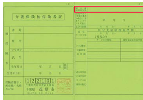
「介護保険被保険者証」