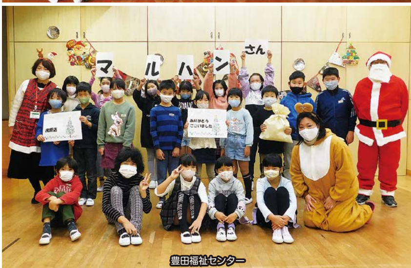
豊田福祉センター

昨年12月、市内福祉センターにある各児童センターで「クリスマス会」を開催しました。新型コロナウイルス感染から大切な子どもたちを守るため、参加者全員がマスク着用、手指消毒を徹底し、例年より静かな雰囲気の中でみなさん楽しんでいました。