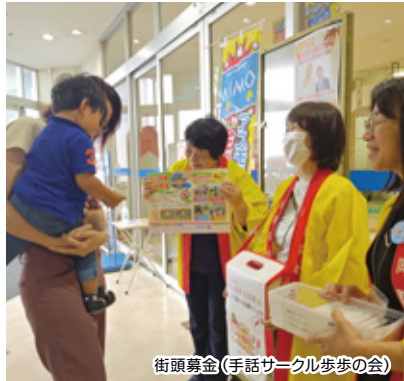
街頭募金(手話サークル歩歩の会)