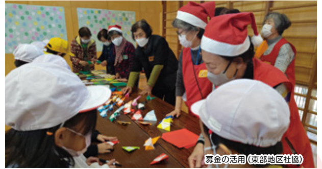
募金の活用(東部地区社協)

■歳末たすけあい募金は、昨年末から年始にかけて、市内の生活が困窮している世帯、児童養護施設の児童、ねたきりの高齢者や障がいのある方に、年末年始を穏やかに過ごせるようお見舞金をお届けしました。また、民間福祉団体の活動支援、見守りが必要な高齢者にカレンダーとソフトタオルをお届けしました。