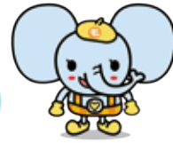
茂原市協 mascot「ふくぞう」