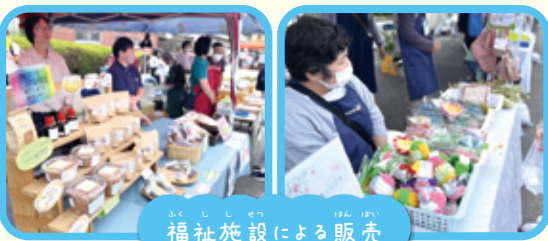
福祉施設による販売