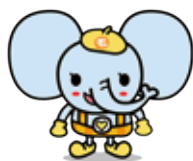
茂原市社協マスコット「ふくそう」