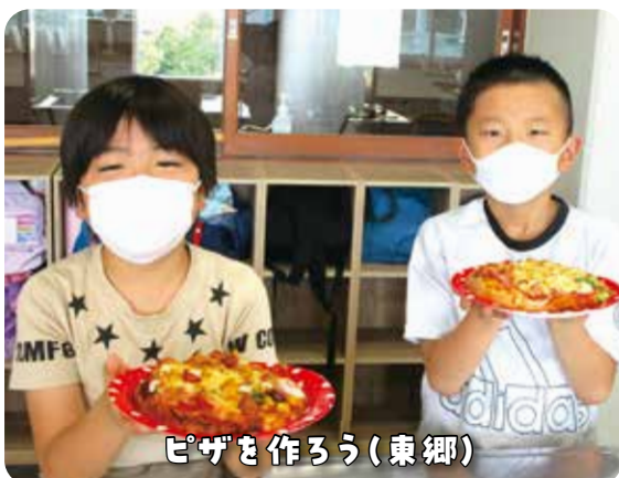
ピザを作ろう(東郷)