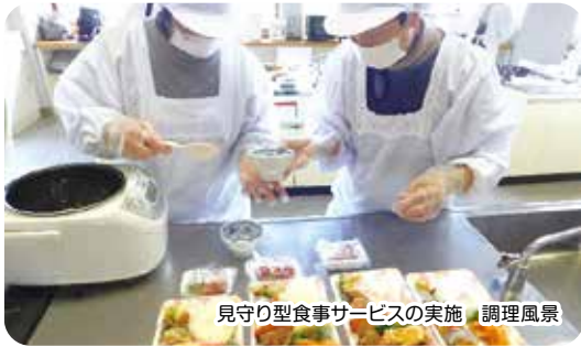
見守り型食事サービスの実施 調理風景