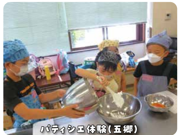
パティシエ体験(五郷)