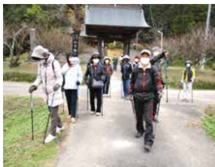
二宮地区社協 『ノルディックウォーキング』