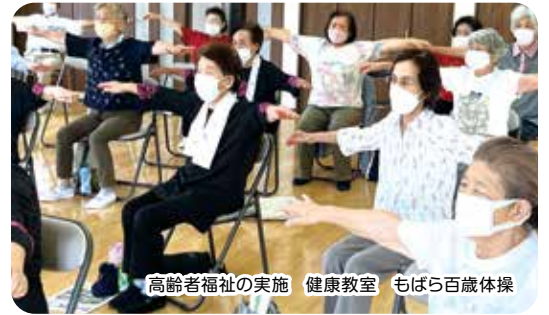
高齢者福祉の実施 健康教室 もばら百歳体操

今年度も一般会員の会員募集及び加入に伴う会費の集金依頼を自治会回覧を通して、6月に依頼させていただきました。