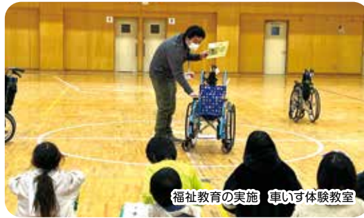
福祉教育の実施 車いす体験教室