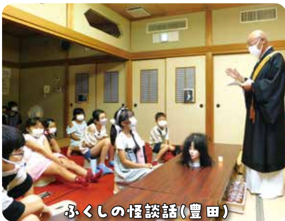
ふくしの怪談話(豊田)