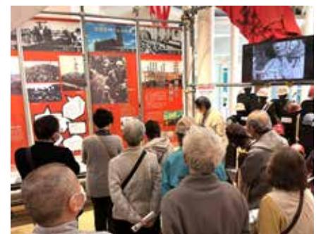
北部地区社協 『おでかけサロン』