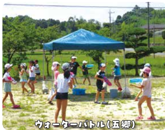
ウォーターバトル(五郷)